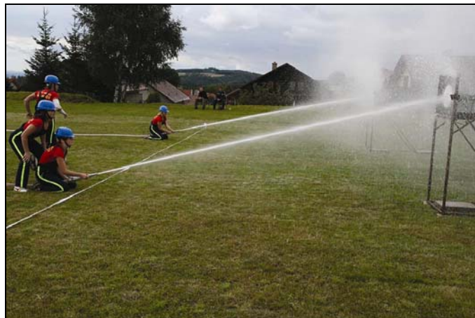
Sbor dobrovolných hasičů