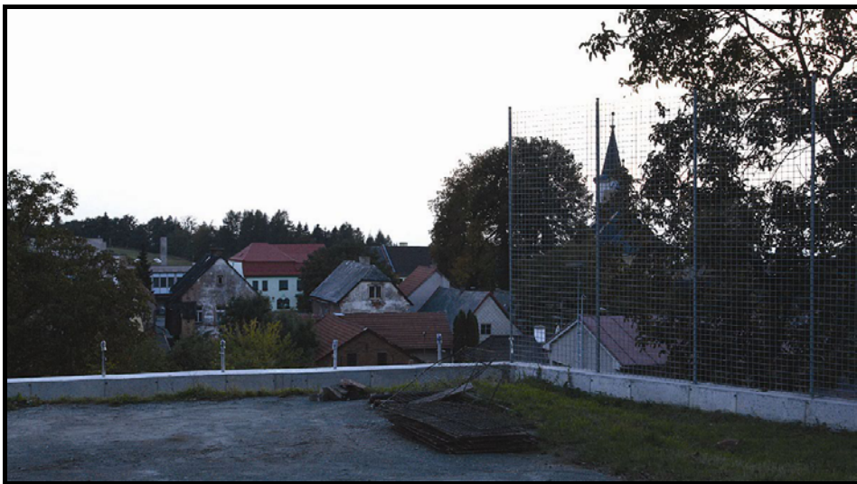
Výstavba nového oplocení školního hřiště.