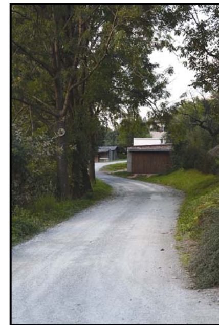
Opravená cesta k písničku

Žáci základní školy se podílejí rovněž na sběru starého papíru, který organizuje na své náklady Městys Nový Hrádek. Za I. pololetí 2007 byla získána tímto sběrem do rozpočtu městyse částka 8 244,- Kč. Částka byla poukázána základní škole na její činnost.