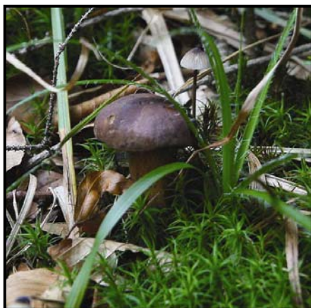
Městys Nový Hrádek

Zastupitelstvo Městysu Nový Hrádek na svém jednání dne 23.8.2007 schválilo podání Žádosti o poskytnutí finanční podpory v rámci Programu „Posilování sociálních, vzdělávacích a zdravotnických služeb v Královéhradeckém kraji“ financovaného z Finančního Mechanizmu EHP/Norska a Královéhradeckým krajem na dokončení akce „Vestavba nových učeben v půdním prostoru ZŠ Nový Hrádek“. Žádost byla zpracována ve spolupráci s Centrem evropského plánování při Královéhradeckém kraji. O osudu naší žádosti bude rozhodnuto v prosinci letošního roku.