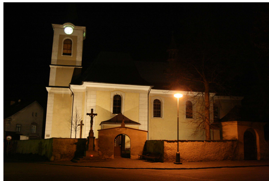
Nově osvětlený kostel sv. Petra a Pavla