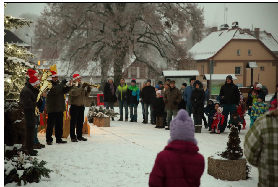
Trubači na náměstí 23.12.2016