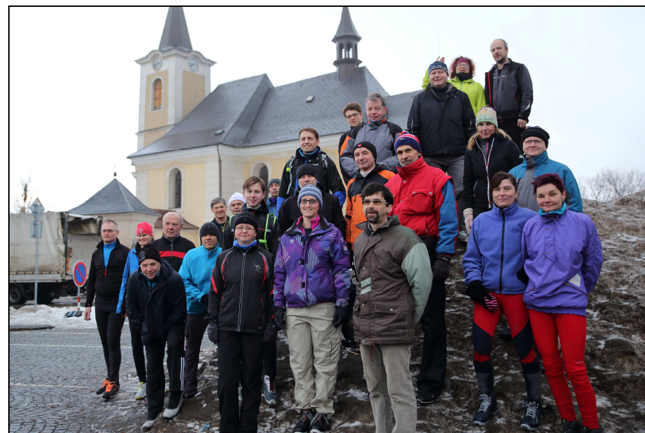
Přejezd Orlických hor 18.2.2017 - sraz na náměstí