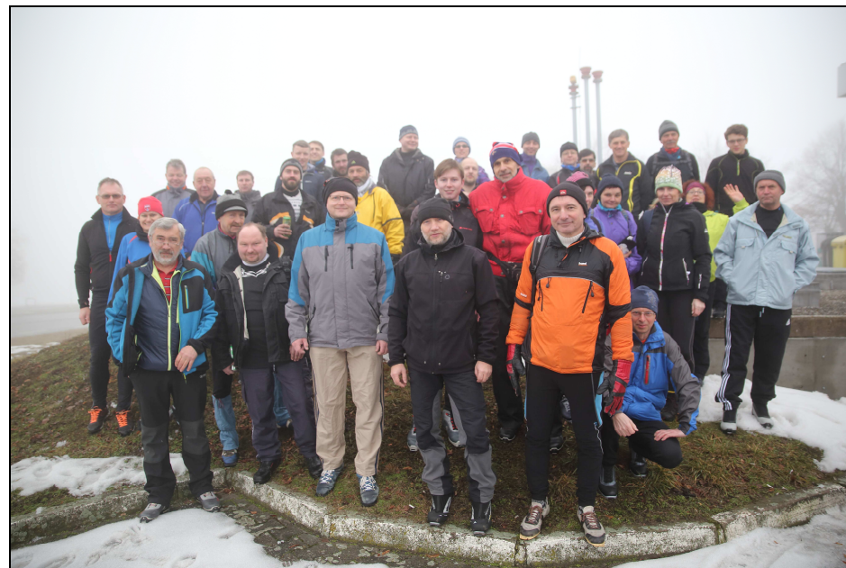
Sraz v Dobrušce

Takže už na parkovišti nám bylo jasné, že ostatní hrádouské lyžaře ten den nejspíš neuvidíme.