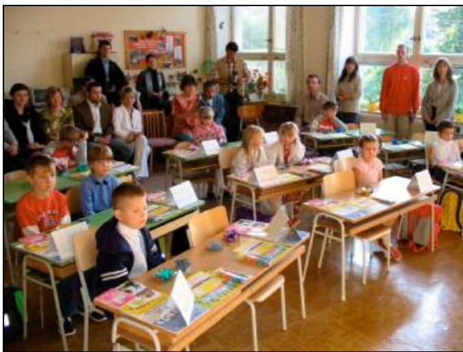
4.9.2006, 1. třída