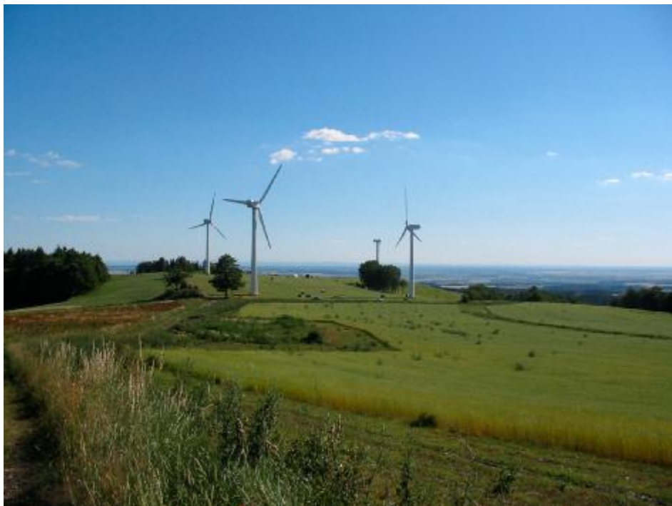
Nefunkční 2. větrná farma v České republice dne 16.7.2006