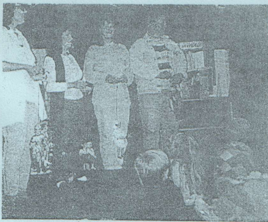
Při inventuře objevili v Novém Hrádku na Náchodsku mj. i šestnáct loutek. Mladí je nenechali jen tak zahálet, vznikli tu loutkoherecký soubor Sokola.