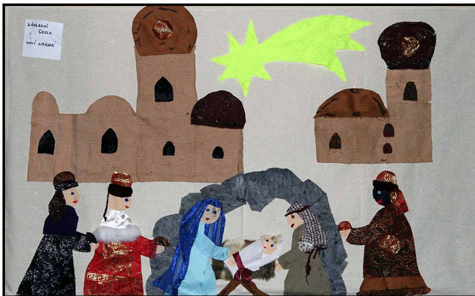
Betlém dětí základní školy v kostele