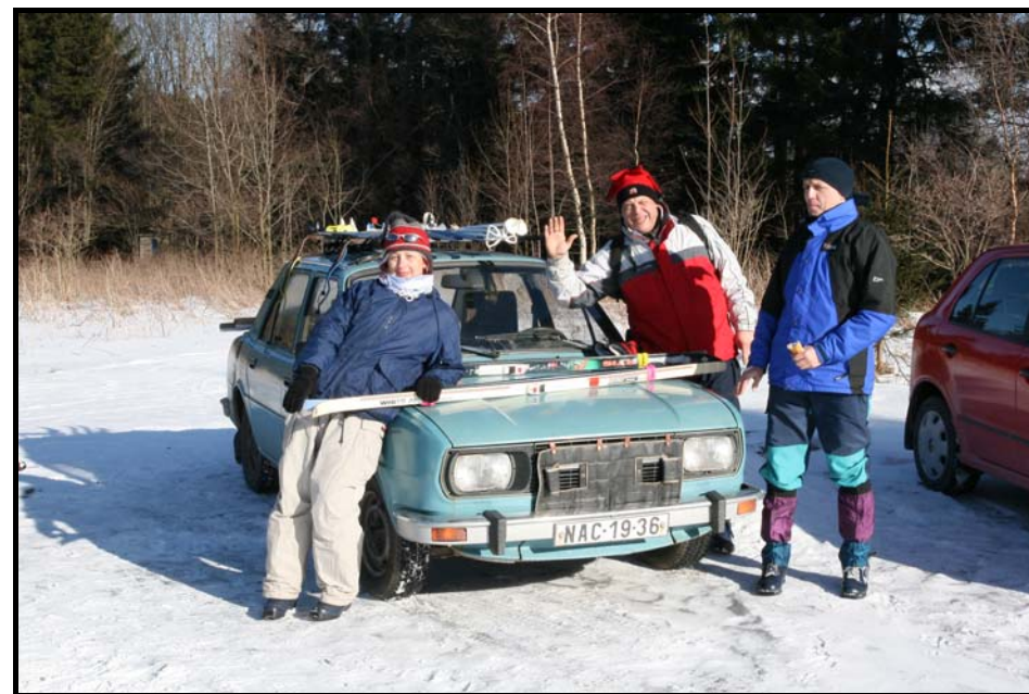
Část lyžařské výpravy šťastně v cíli na Haničce