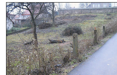
Úprava terénu pod školním hřištěm