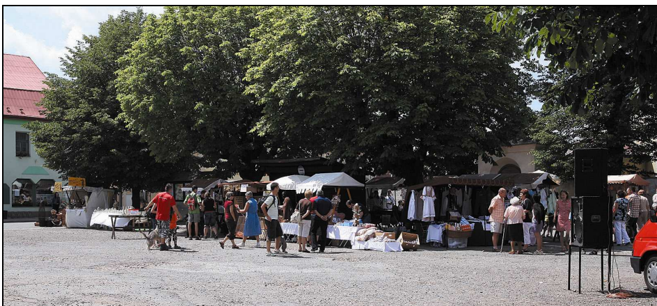
Remeslnické trhy na náměstí 29.6.2008