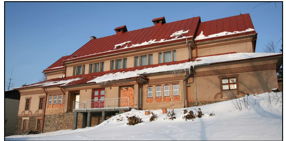
Zadní strana sokolovny po 1. etapě rekonstrukce