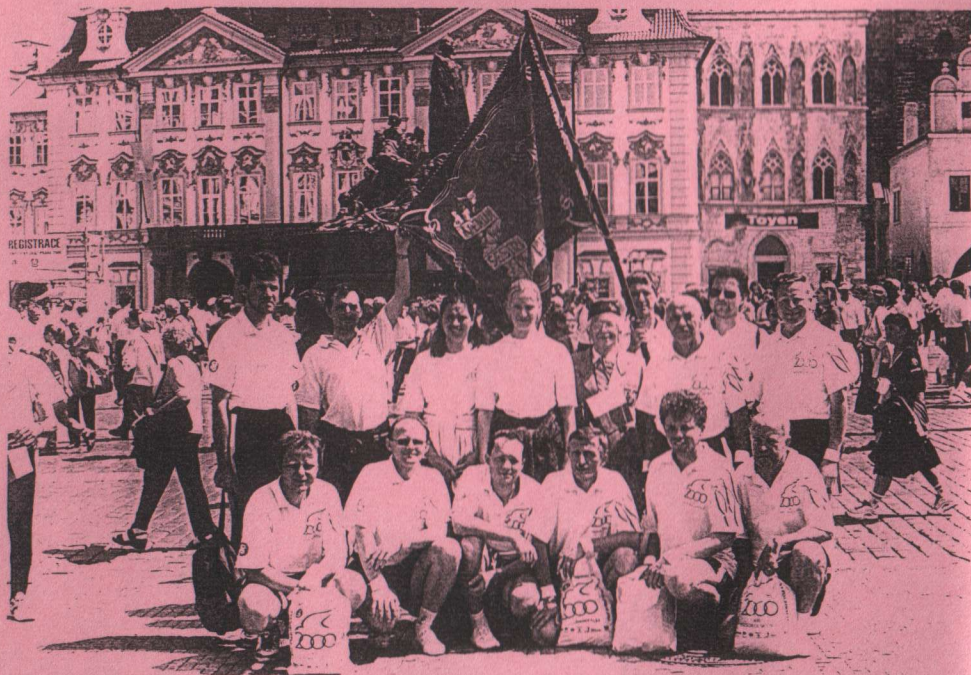
Ohlédnutí za XIII. Vsesokolským sletem v Praze