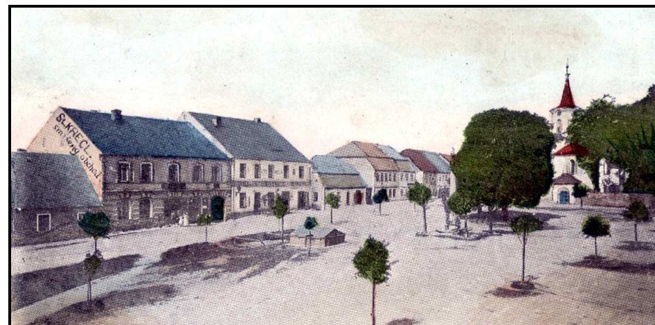
Náměstí kolem roku 1900

Snad nejproslulejším náměstím antického světa, mnohem známějším než athénská agorá, je Forum Romanum , hlavní náměstí starověkého Říma, dodnes jedno z římských lákadel turistů pro dochované pozůstatky chrámů, vítězných oblouků atd. Leží mezi pahorky Kapitolem a Palatinem a bylo jakýmsi středem světovládné římské říše. Vyčázely odtud silnice do provincií, stál zde senát, za republiky nejdůležitější státní orgán, také tu byl státní archiv, zdobilo je množství soch.