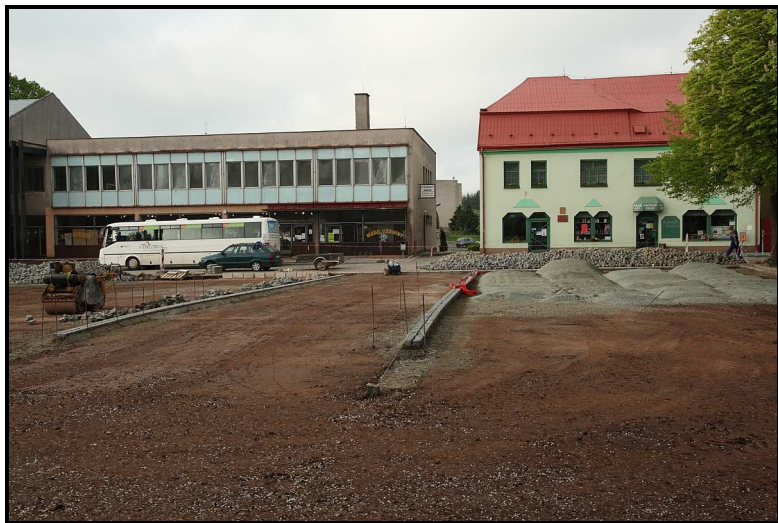
Rekonstrukce náměstí, 22.5.2010

Na severozápadní kratší straně Náměstí (dříve náměstí Rudé armády) stojí kostel sv. Petra a Pavla, hřbitovem obklopený a nerozlučně spojený s prvním historickým datem vztahujícím se k existenci lokality (18. červenec 1362). V roce 1721, kdy byla na Novém Hrádku obnovena fara, vyhořel jeho dřevěný předchůdce. Současný barokní kostel, asi podle projektu J. Santiniho, pochází z let 1722 – 1727. U kostela zůstala zvonice s bedněným patrem a podsebitím až do požáru, který 9. května 1843 zachvátil celé náměstí. Při následné opravě došlo k přístavbě věže. Další oprava se realizovala až v roce 1926. Na náměstí byl v roce 1747 instalován mariánský sloup, z roku 1864 pochází kašna a z roku 1868 kamenný krucifix před hřbitovni zdí u kostela.