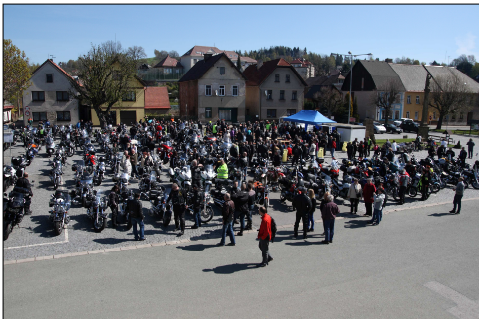
1. Nový moto Hrádek 30.4.2016