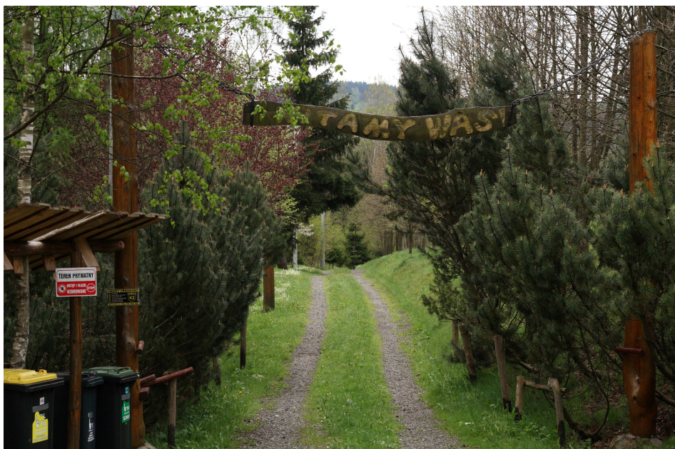
Letošní Hrádouská vařečka vedla přes polský Taszów