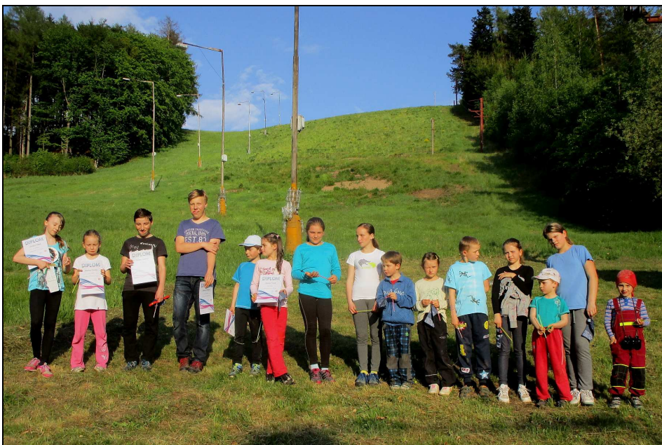
Zakončení výcvikového roku lyžařů 20.5.2016