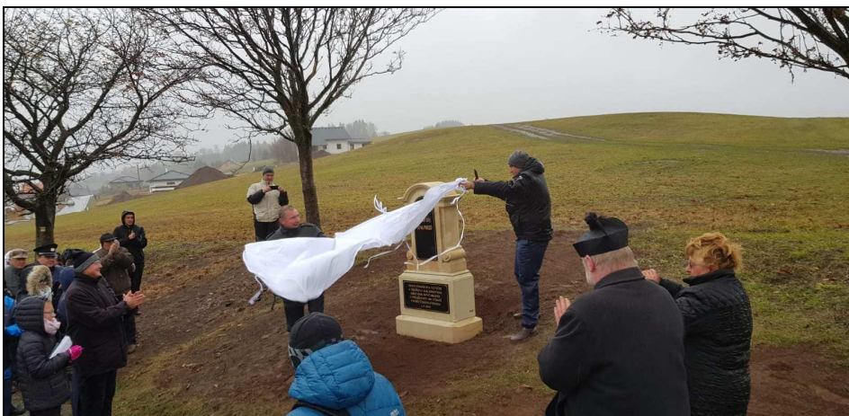
Odhalení pomníku "Zemský ráj to napohled"