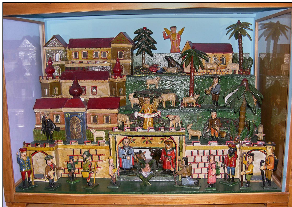
Skříňový betlém z roku 1939