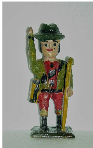
Typické figurky s velkýma černýma očima