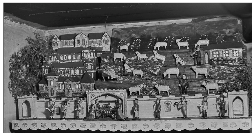
Betlém z jeho chaloupky, zavěšený u stropu mezi trámy