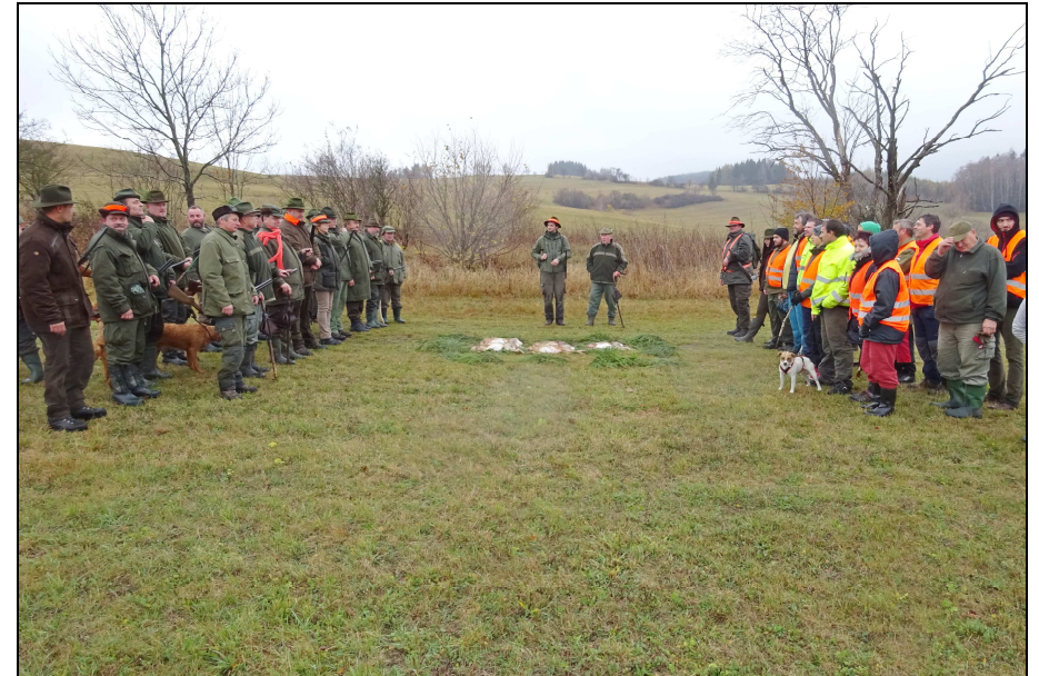
Bylo uloveno 5 zajíců polních