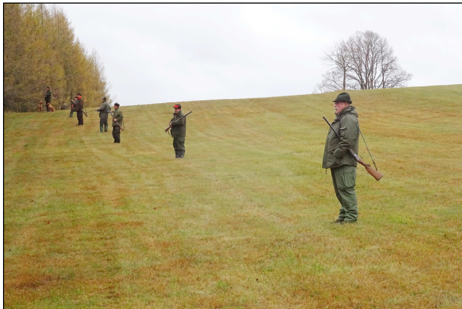
Dne 3.11.2018 jsme uspořádali hon na drobnou zvěř