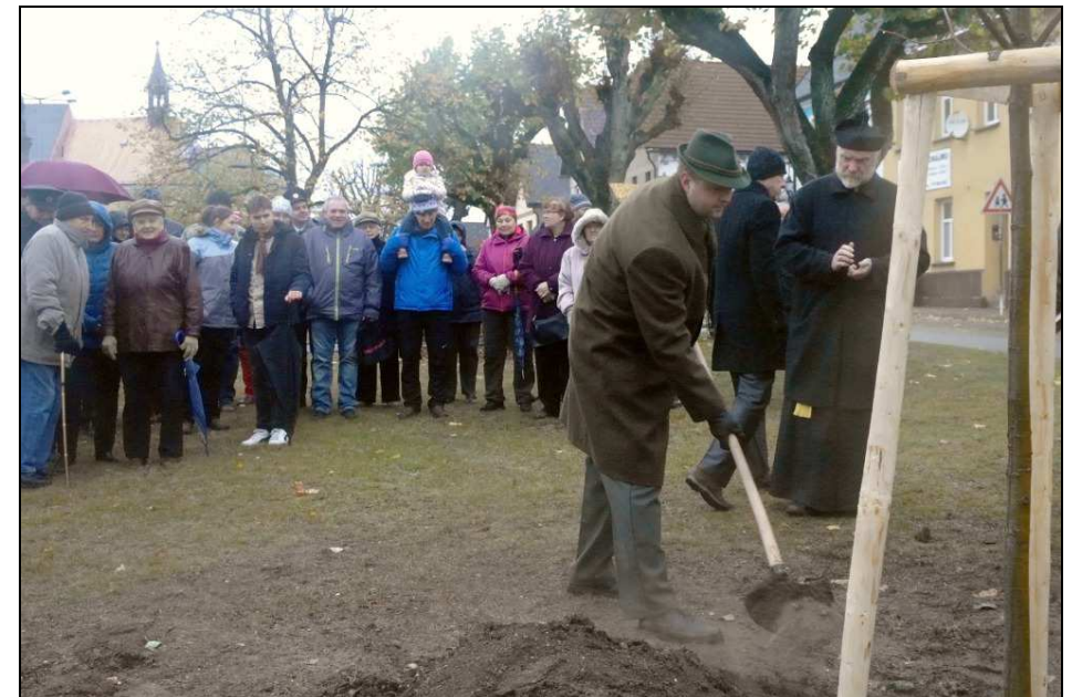
Zástupci našeho spolku se zúčastnili dne 28.10.2018 oslavy výročí 100 let republiky