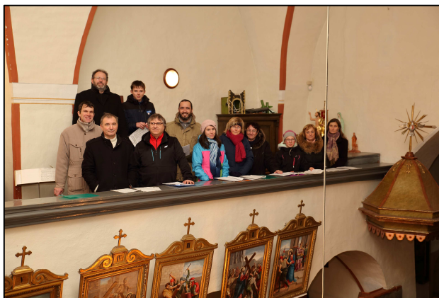
Chrámový sbor v kostele v Černčicích 30.12.2017