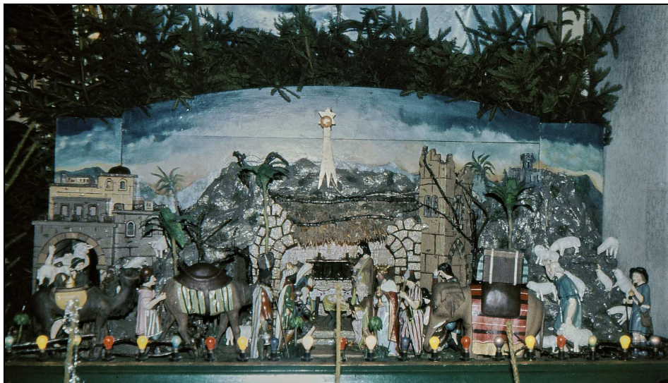
Původní betlém se žárovkami (foto ze začátku 80. let 20. století)

V roce 1924 bylo zavedeno v Novém Hrádku elektrické světlo, osvětlení bylo rovněž zavedeno na faru a do kostela. Při této příležitosti byl osvětlen za 356,35 Kč také betlém, a to velkými barevnými žárovkami. Tyto byly z betléma odstraněny koncem 90. let 20. století za pana faráře Jaroslava Mikeše.