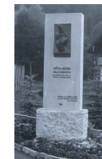
Pomník Rzy /1947/

Zhotovení panelu a úpravy okolí pomníku provedl městysem Nový Hrádek za laskavé podpory Královéhradeckého kraje a Krajského ředitelství policie Středočeského kraje.