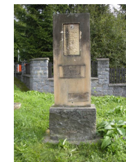
Pomník Rzy /2010/