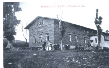
Čtvrtečka hospoda na Dlouhém /1911/

V roce 1940 byly v obci dva hostince, jeden smíšený obchod, brusírna skla, mlýn a pět strojních tkalcoven. Po druhé světové válce se obec začala vyhlížovat.