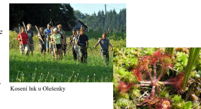
Kosení luk u Olešanky Rosnatka okrouhlostlá

Další přírodně významné území představují údolní louky a olšiny s přirozeně meandrující říčkou Olešenkou v osadě Rzy, které hostí mnoho vzácných druhů rostlin i živočichů. Tato společenstva byla v minulosti ohrožena především jejich odvodňováním, přisunem velkého množství živin, ponecháním ladem a následným zarůstáním. Od roku 1989 se tento stav výrazně zlepšil díky aktivitám Českého svazu ochránců přírody JARO Jaroměř, který organizuje pravidelné pracovní tábory, jejichž hlavní náplní je kosení luk, ale i třeba budování tůnek pro obojživelníky a likvidace invazních rostlin.