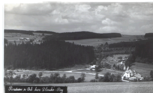
Bartoňovy vily a Zelinkův mlýn /1936/