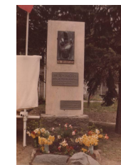
Pomník Rzy /1990/