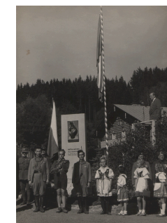
Odhálení pomníku Janem Masarykem /1947/