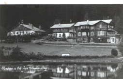
Zotavovna MV /1957/

V roce 1905 byla z Rokole do Olešnice vybudována okresní silnice. V letech 1907 – 1908 byla přes obec vyměřena železnice, k jejíž realizaci nikdy nedošlo