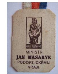
Pamětní stužka /1947/