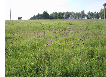
Přírodní památka rašelina

Po první jarní oblevě je většina těchto luk zaplavena stovkami bledulí ( Leucojum vernum ). Mezi chráněné druhy, které zde rostou, patří např. rosnatka okrouhlostlá ( Drosera rotundifolia ), vachta trojlistá ( Menyanthes trifoliata ), kosatec sibiřský ( Iris sibirica ), ostřice Davaľlova ( Carex davalliana ), úpolin nejvyšší ( Trollius altissimus ) z orchidejí např. prstnatec májový ( Dactylorhiza majalis ), vemeník dvojlístý ( Platanthera bifolia ) a braďáček vejčitý ( Listera ovata ). Z živočichů zde našlo svůj domov mnoho motýlů, např. modrásek bahenní ( Maculinea nausithous ), druh chráněný v rámci evropské soustavy NATURA 2000, otakárek fenyklový ( Papilio machaon ) patříci mezi ohrožené druhy našich motýlů. V tůních se rozmnožují čolci horští ( Mesotriton alpestris ) a skokani hnědí ( Rana temporaria ). Z plazů byly zjištěny populace ještěrky živorodé ( Zootoca vivipara ) a úlovky obojvků ( Natrix natrix ), z obojživelníků pak ropucha obecná ( Bufo bufo ). Nad hlavami vám může proltnout silně ohrožený dravec včelojed lesní ( Pernis apivorus ), nepravidelně zde hnízdí i ohrožený bramboříček hnědý ( Saxicola rubetra ) a v březích Olešanky si buduje své nory ledňáček říční ( Alcedo atthis ).